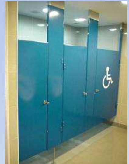
Edificio Consistorial Lo Espejo

4.- Metálicos con pintura electroestática al horno